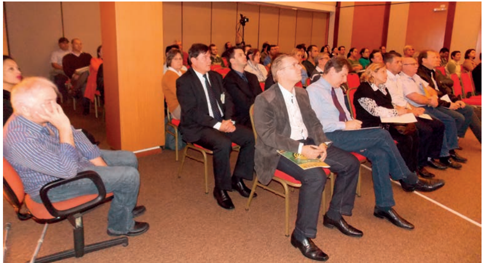
A palestra foi ministrada no auditório do CRCPR, dia 16 de julho, no horário das 14h às 17h.

A palestra focou os obstáculos criados pelos municípios para enquadramento no ISS-Fixo das sociedades profissionais, analisando a fundamentação legal do imposto, tipos societários que não dão direi-