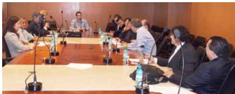
Comissão reuniu-se dia 14 de junho na sede do conselho

Saber o número de profissionais que atuam na área no estado é outra preocupação para facilitar a organização de eventos e a troca de informações. Estimativas elásticas sugerem a existência de pelo menos 1.500 contabilistas traba-