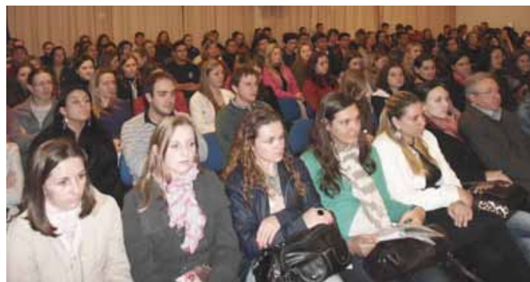
Em União da Vitória, aproximadamente 200 pessoas conheceram o projeto na UniuV.