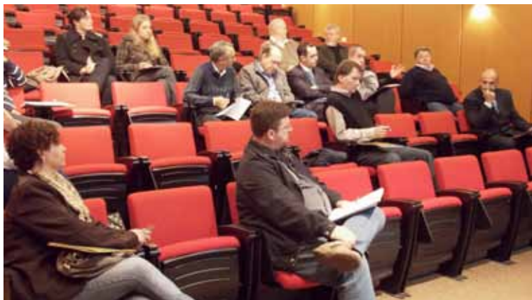
Docentes recebem questionário que ajudará a definir rumos do projeto no segundo semestre de 2012

Na reunião da Comissão de Estudos para Educação e Desenvolvimento Profissional do CRCPR, realizada em Curitiba dia 14/6, coordenadores e professores de 17 cursos de ciências contábeis de diferentes regiões receberam um questionário que visa levantar dados indicativos do nível de relacionamento existente entre CRC e instituições de ensino. A bateria de perguntas é um dos instrumentos que auxiliará na definição dos rumos do projeto no segundo semestre.