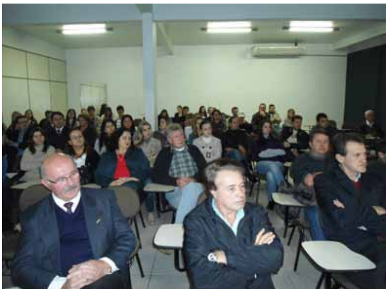
Auditório das Faculdades Alto Iguaçu (FAI) em Laranjeiras do Sul

O Departamento de Fiscalização do CRCPR passou a oferecer recentemente aos profissionais da contabilidade dois importantes serviços para esclarecer as principais dúvidas