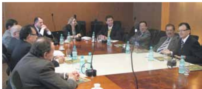
Ex-presidentes do CRCPR compõem o Conselho

P revisto pelo regimento interno e criado em 2004 pela Resolução 575, o Conselho Consultivo do CRCPR reuniu-se pela primeira vez dia 22 de maio para se integrar, se inteirar das atividades do Conselho e gravar mensagens que serão utilizadas em eventos da classe contábil.