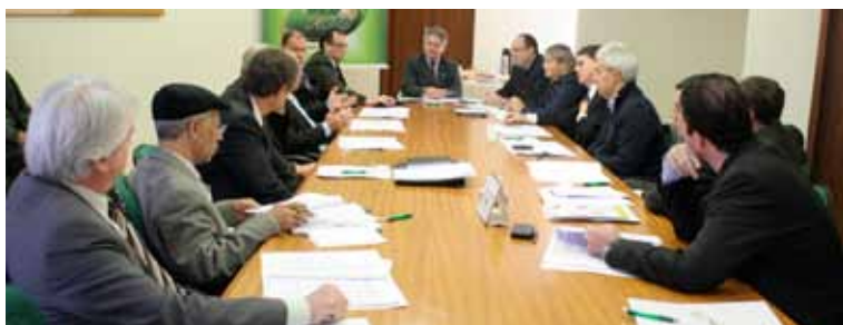
Reunião dia 28 de maio, na sede do Sescap-PR.

A contribuição mais significativa dos profissionais da contabilidade ao código foi concentrada nas obrigações acessórias e nas multas abusivas impostas às empresas, resalta a presidente do CRCPR. A proposta da classe sugere a redução do número de obrigações, maior prazo para adequação e diferenciação dos valores das multas de acordo com o tamanho das empresas.