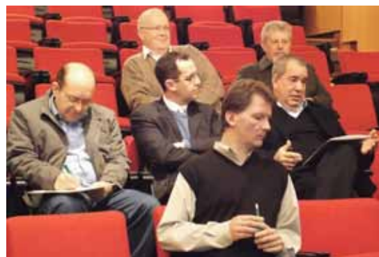
Coordenadores de cursos de ciências contábeis no auditório do CRCPR

Agora, instituído pela Lei nº 12.249/2010, o exame passou a ser obrigatório, voltando a ser aplicado desde 2011,