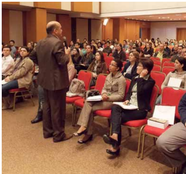
Mais de 140 pessoas participaram do curso em Curitiba, dia 4 de julho.

Mais informações pelo telefone (41) 3360-4700 (Curitiba).