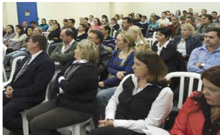
São José dos Pinhais: público lotou auditório na Faculdade Metropolitana de Curitiba.

Um encontro exclusivamente marcado para debater o Primeiros Passos juntou cerca de 200 estudantes, além de dezenas de profissionais, no auditório da União Dinâmica de Faculdades Cataratas (UDC), em Foz do Iguaçu, dia 24 de maio.