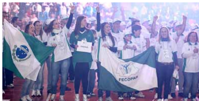
Paranaenses comemoram o título

O Paraná venceu seis das oito modalidades da competição - duas delas realizadas em caráter experimental (sem contagem de pontos). A vitória foi comemorada pelos jogadores, comissão técnica, presidentes e diretores dos sindicatos de contabilistas do estado e pela diretoria da Fecopar, responsável pela delegação paranaense. “Assim como o Jo-