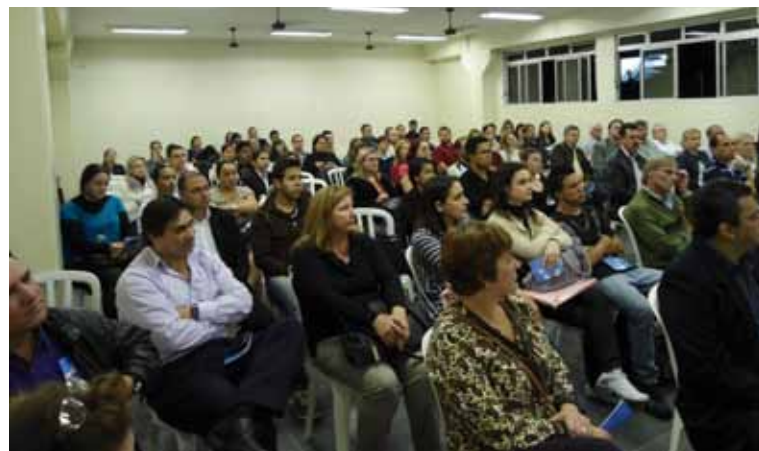
São José dos Pinhais: Faculdade Metropolitana de Curitiba.

Já o Perguntas & Respostas, construído a partir das dúvidas mais comuns enviadas à Fiscalização, abordou os seguintes assuntos: demonstrações contábeis, autenticação de