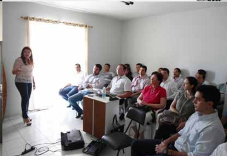
Abertura de fiscalização Jaguariaíva

Grande do Sul na região metropolitana de Curitiba através da fiscalização eletrônica FISC-E. Essas ações têm toda uma planificação antecipada e objetivam a visita a todas as organizações contábeis existentes nos municípios visitados, formalizadas e precipuamente as não formalizadas, bem como as empresas com contabilidade própria, órgãos públicos, entidades sem fins lucrativos, instituições financeiras, entidades de ensino, poder judiciário, partidos políticos e outras entidades.