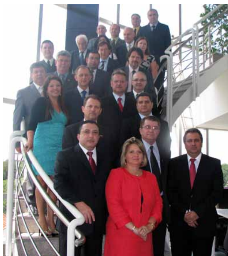
Conselheiros gestão 2012 - 2013

A nova gestão vai carregar ainda no papel social da entidade, ampliando a defesa de questões que interessam à sociedade - “O contabilista fica orgulhoso quando vê seu órgão de classe presente nas discussões de assuntos importantes” – e aprofundando as parcerias com as entidades da classe e demais entidades sociais.