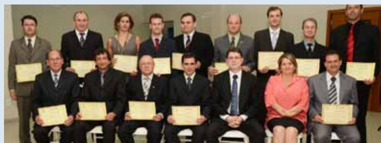
A nova diretoria do Sincobel