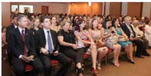
Auditório do CRCPR

A palestrante deu dicas de motivação, organização e saúde que podem trazer muitos benefícios à qualidade de vida das mulheres, principalmente hoje em que muitas, além do trabalho, ainda cuidam da casa e dos filhos. Argumentou e deu muitos exemplos de como a organização do tempo é importante: Organizar a agenda do dia a dia, fazer o planejamento da semana, do