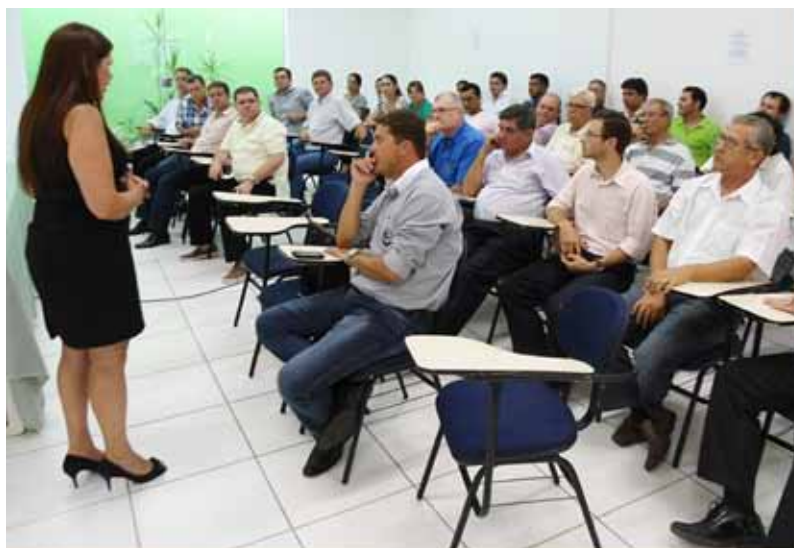
Abertura de fiscalização Loanda