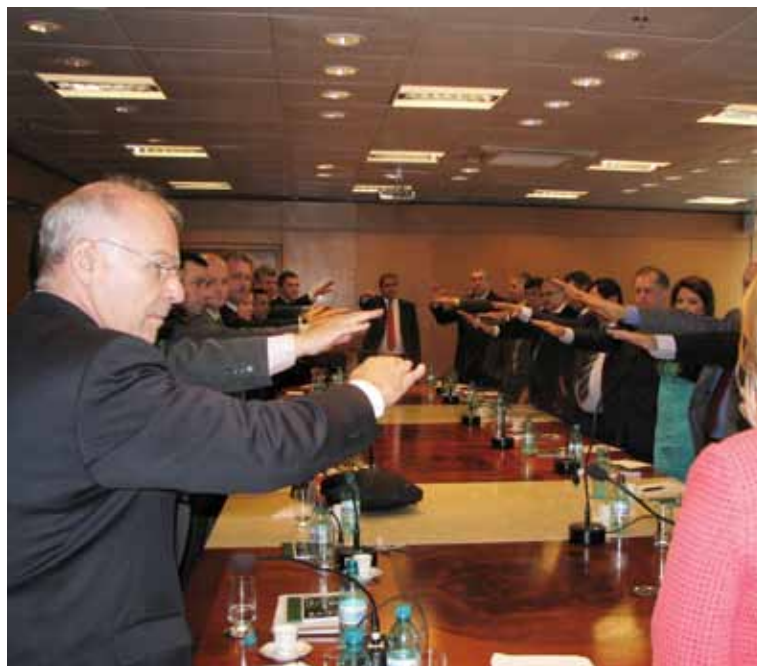
Conselheiros fazem o juramento

O CRCPR atende mais de 34 mil profissionais registrados, mantendo uma estrutura física de escritórios nas maiores cidades - Londrina, Maringá, Ponta Grossa, Cascavel, Foz do Iguaçu, Francisco Beltrão, Guarapuava e Toledo – e delegacias em 52 cidades compondo jurisdições que abrangem os 399 municípios do estado. Além dos serviços de registro, cadastro, emissão da carteira profissional, aplicação do exame de suficiência, o CRCPR desenvolve projetos de fiscalização verificando se os agentes contábeis têm habilitação, se os trabalhos estão de acordo com as normas e princípios contábeis, oferece programas de educação continuada presenciais e à distância e também projetos de responsabilidade social.