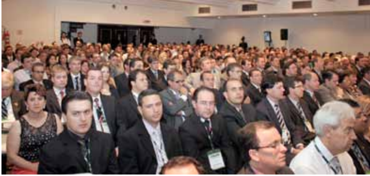
Auditério do Hotel Bourbon