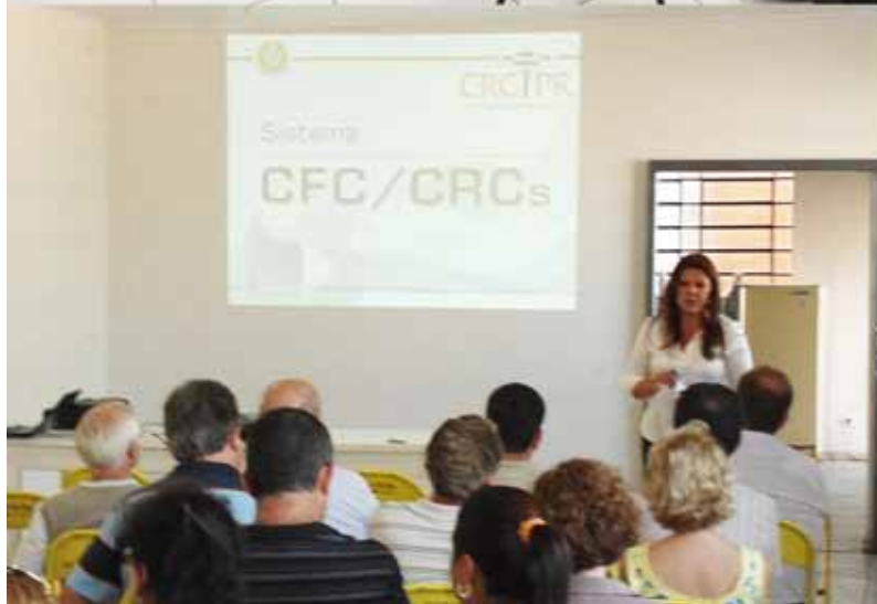
Abertura de fiscalização Jacarezinho