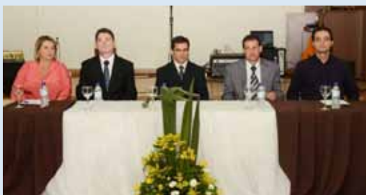
Mesa de honra

E leita em novembro último com índice de 98,2% dos votos válidos, a nova diretoria do Sincobel (Sindicato dos Contabilistas de