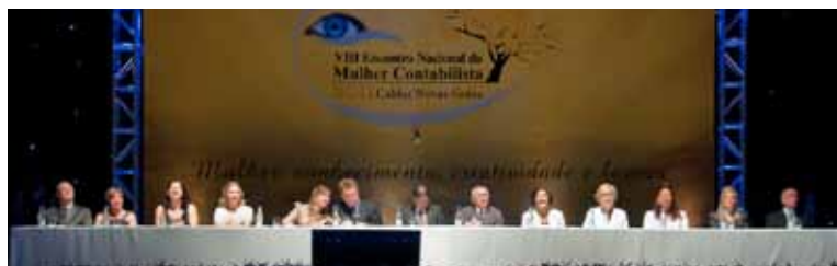
Mesa de honra

Foz do Iguaçu vai sediar a edição de 2015