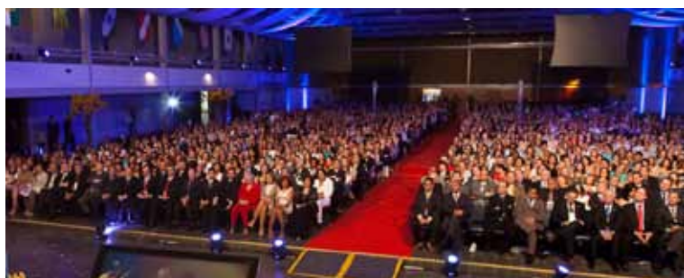
Duas mil pessoas participaram do encontro

D ois mil contabilistas, vindos de todo o Brasil, participaram, de 19 a 21 de maio, do VIII Encontro Nacional da Mulher Contabilista, em Caldas Novas, Goiás. Uma das maiores expectativas do evento foi a votação para a escolha da sede do próximo encontro, concorrendo os estados do Paraná com a cidade de Foz do Iguaçu, Rio Grande do Sul com Gramado, Rio de Janeiro e São Paulo. A cidade paranaense perdeu a edição de 2013 por apenas seis votos, mas conquistou antecipadamente o direito de sediar o encontro de 2015 – fato inédito na história do evento.