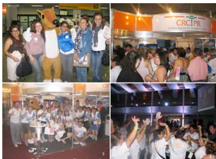
(1) O quati, símbolo da campanha de Foz, fez sucesso no encontro. (2) O estande do CRCPR foi um dos mais movimentados. (3) Delegação do Paraná. (4) Paranaenses comemoram o resultado da votação.