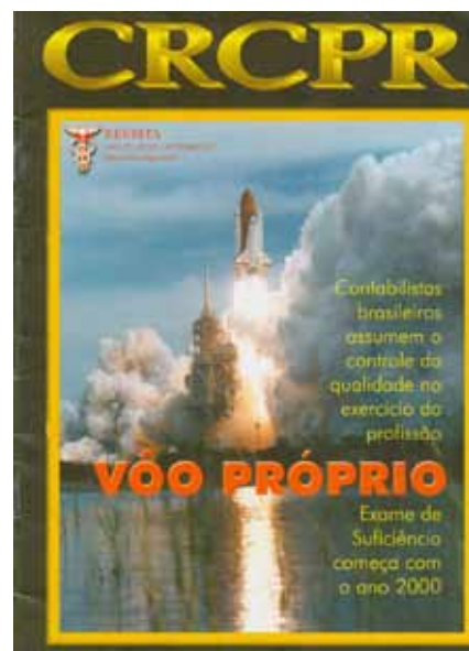
Revista do CRCPR, edição 125, outubro de 1999

Além de trazer de volta o exame de suficiência, a Lei nº