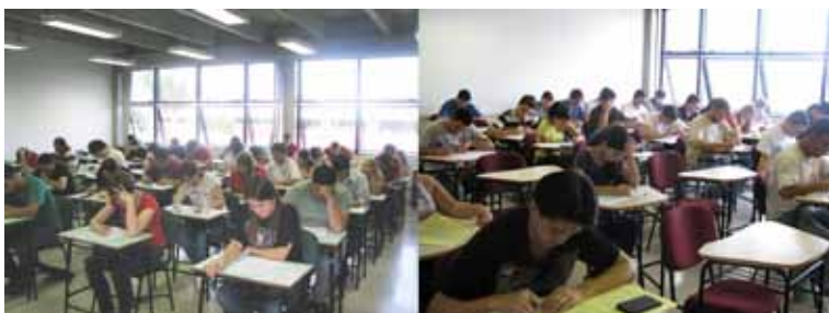
Candidatos fazem provas em Curitiba

Prevendo impactos sobre a formação dos contabilistas,