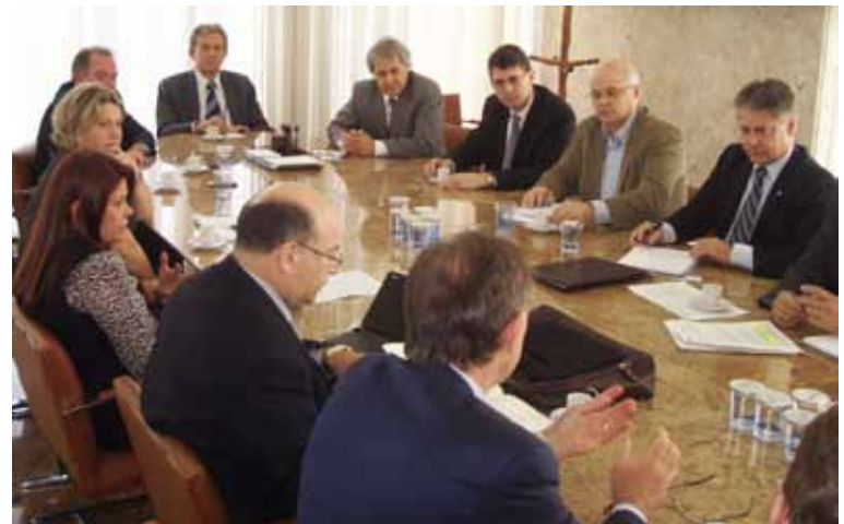
O pedido de prorrogação foi feito, dia 7 de abril, por representantes de entidades contábeis e da indústria e comércio à diretoria da Receita Estadual

Na ocasião, os representantes das entidades apontaram dificuldades das empresas para elaborar e enviar a escrituração no primeiro prazo. A obrigatoriedade atinge um grupo de aproximadamente 10 mil empresas no estado, aquelas com faturamento mensal a partir de R$ 850 mil. Em razão de aspectos ainda obscuros sobre a Escrituração Fiscal Digital foi também firmado um acordo com a Secretaria da Fazenda para a realização de palestras que vão orientar os contabilistas sobre a questão.