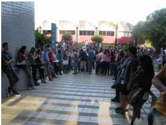
Candidatos aguardam a abertura das salas na UFPR, câmpus Jardim Botânico, em Curitiba

de 16 mil inscritos, pouco mais de 1.400 no Paraná. Já foram divulgados os gabaritos das questões objetivas das provas da edição de março e, na sequência, sai a relação dos