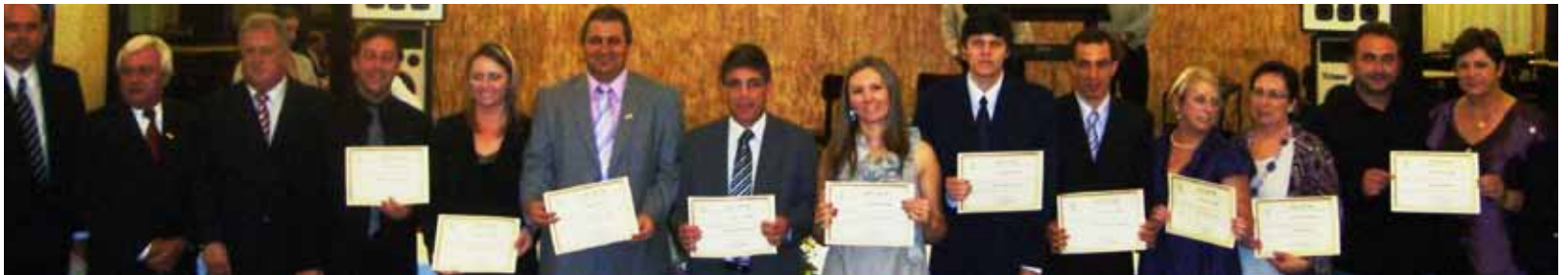
Nova diretoria do Sindicounião