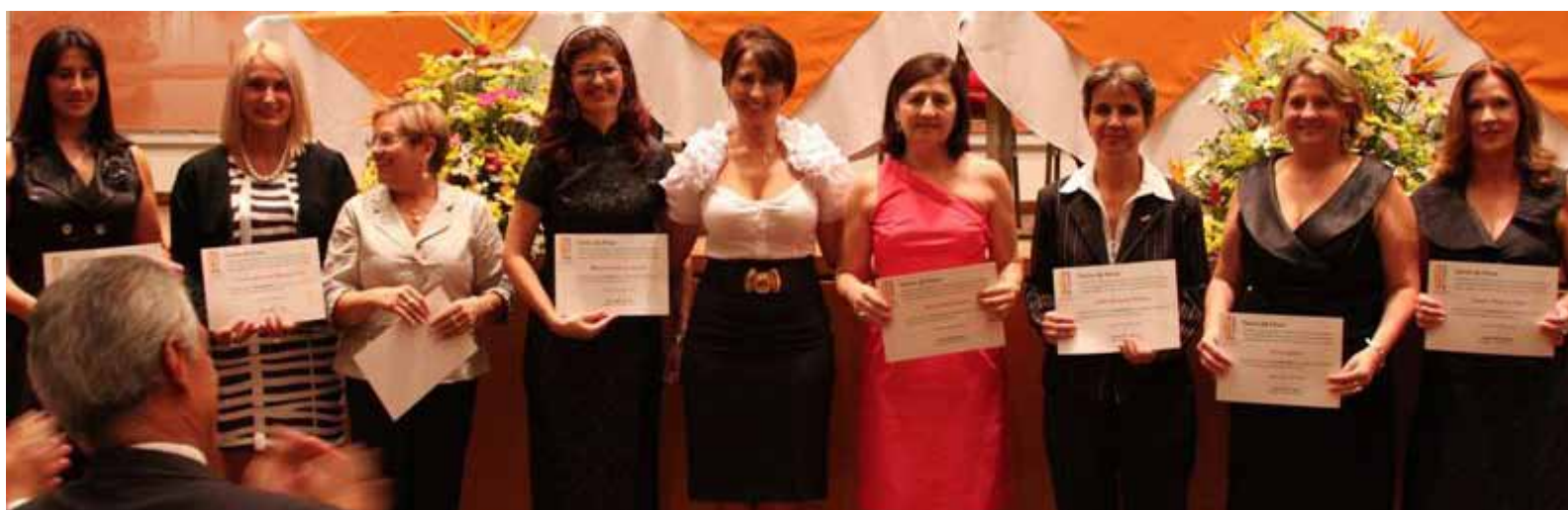
A nova diretoria do IPMCont