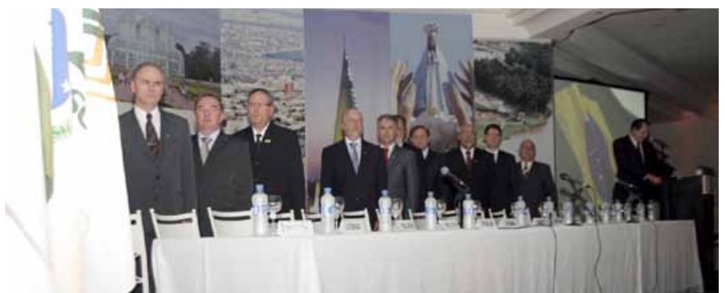
A solenidade foi prestigiada por personalidades da classe contábil e dos meios político e empresarial