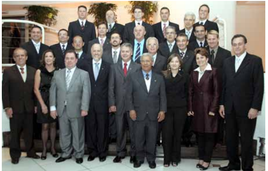
Nova diretoria do Sescap-PR