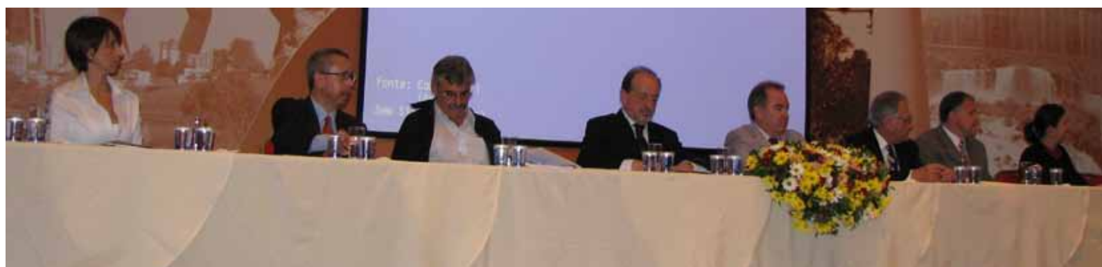
Mesa de autoridades

O Programa Primeira Exportação tem desenvolvimento previsto para 2,5 anos com acompanhamento sistemático das empresas. A intenção é incluir pelo menos 20 novas empresas no Paraná. A agenda de trabalho implica na organização de um Comitê Gestor formado por membros do governo estadual e das entidades empresariais.