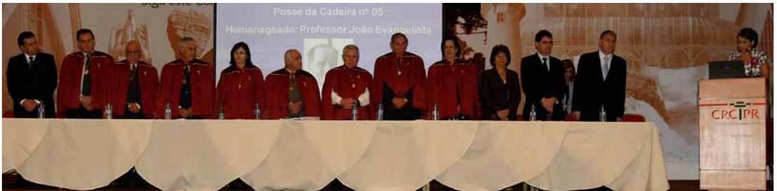
A solenidade foi no auditório do CRCPR