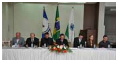
Composição da mesa de honra