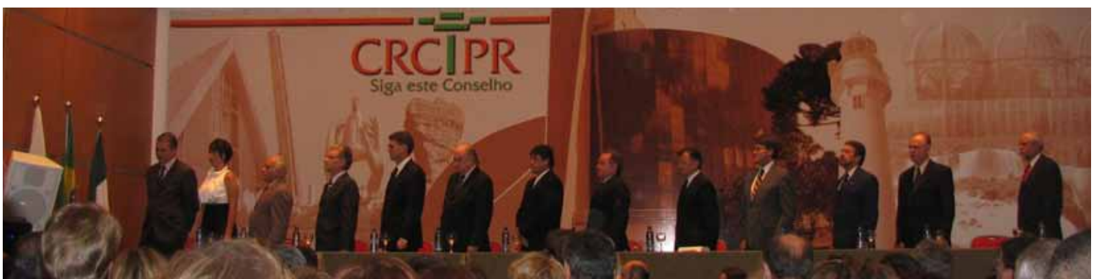
Momento da execução do Hino Nacional