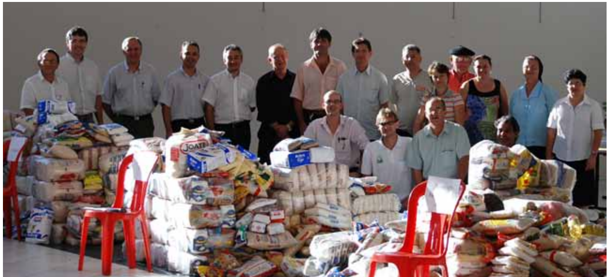
Natal sem Fome arrecada 10 toneladas de alimentos em Toledo.

Várias toneladas de alimentos não-perecíveis, mas também materiais de limpeza e brinquedos, foram arrecadadas e distribuídas a instituições escolhidas pelos