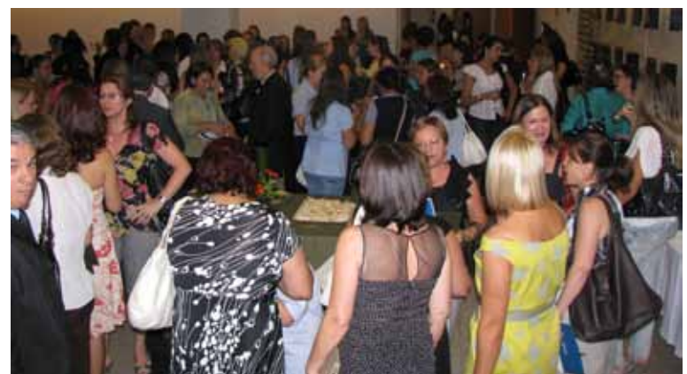
Depois da palestra, coquetel de confraternização