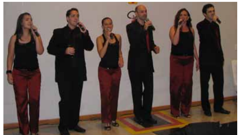
Grupo Chorus de Londrina animou a festa

O Hino Nacional foi cantado pelo grupo Chorus, de Londrina, que brindou o público com antologias da música popular brasileira, antes de começar a solenidade e depois, durante o coquetel, servido no hall do prédio do Conselho.