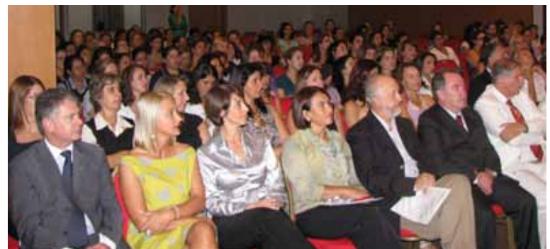
Um público predominantemente feminino na palestra comemorativa ao Dia da Mulher, no CRCPR