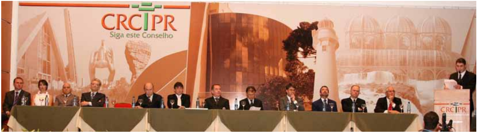
Autoridades que compuseram a mesa