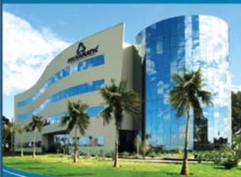
Filial Folhamatic Curitiba/PR 7º andar - Ed. Glaser