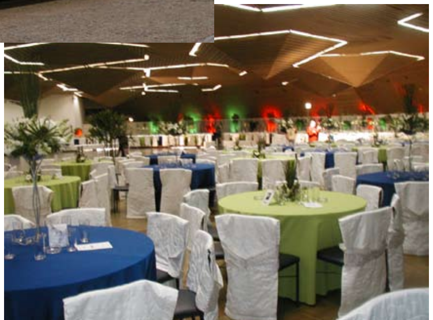
A solenidade de abertura, o desfile das delegações e o jantar de confraternização serão realizados na sede social do Paraná Clube.

“ B em-vindos ao 17º Jogos dos Contabilistas do Paraná (Jocopar)”, dirá o mestre de cerimônias, ao som rumoroso dos aplausos. Começará assim o ritual de abertura da competição, vindo em seguida as falas dos dirigentes e a apresentação das delegações. Serão quatro dias de competição, de 11 a 14 de novembro. Mas, enquanto essa hora não chega, os organizadores correm para acertar os últimos detalhes.