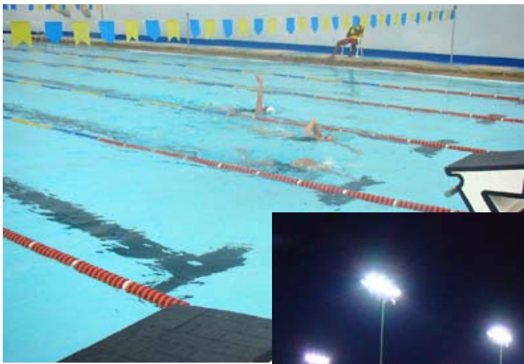
O significado dos jogos

Apesar da competitividade, das provocações e dos anseios, uma ideia comum vaga pela cabeça de cada contabilista que participa dos jogos.