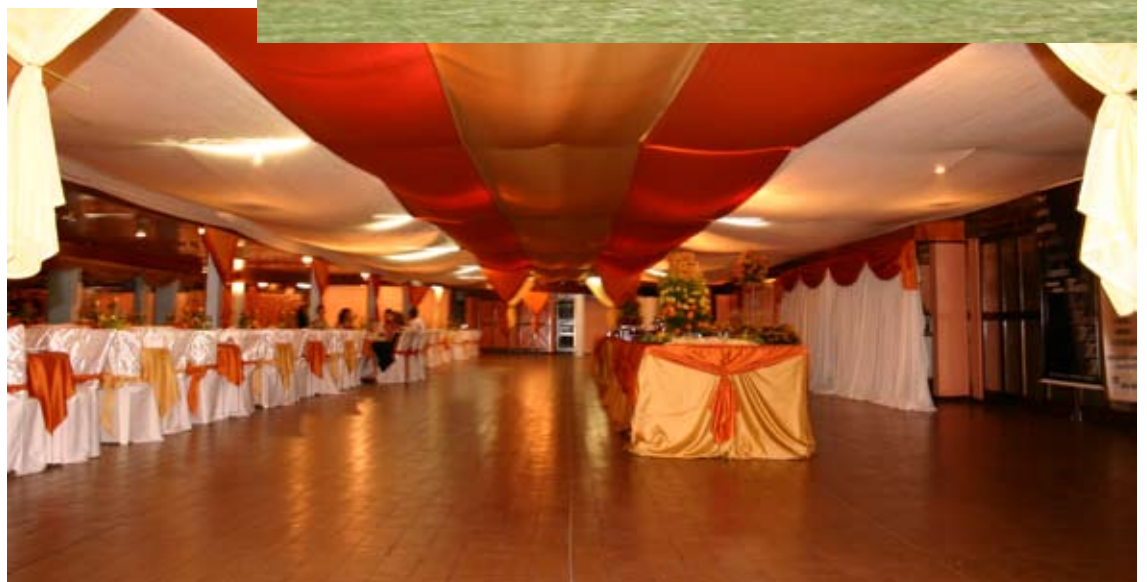
A festa de encerramento e as finais do futebol suíço acontecem na Associação Banestado, dia 14.