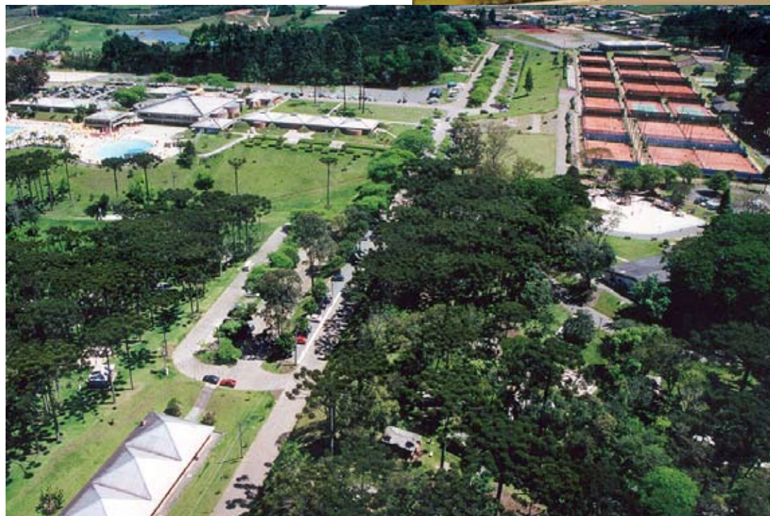
As competições serão realizadas no Santa Mônica, clube que possui gigantesca estrutura para atender mais de 30 mil associados e ocupa uma área de 72 alqueires, com cerca de seis quilômetros de trilhas ecológicas.