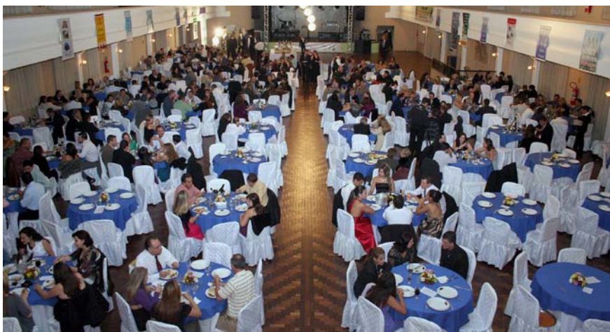
Jantar comemorativo ao Dia do Contabilista, na Sociedade Morgenau, em Curitiba.

de brasileiros que fazem pequenos serviços, garantindo-lhes direitos sociais e alternativas de crescimento.