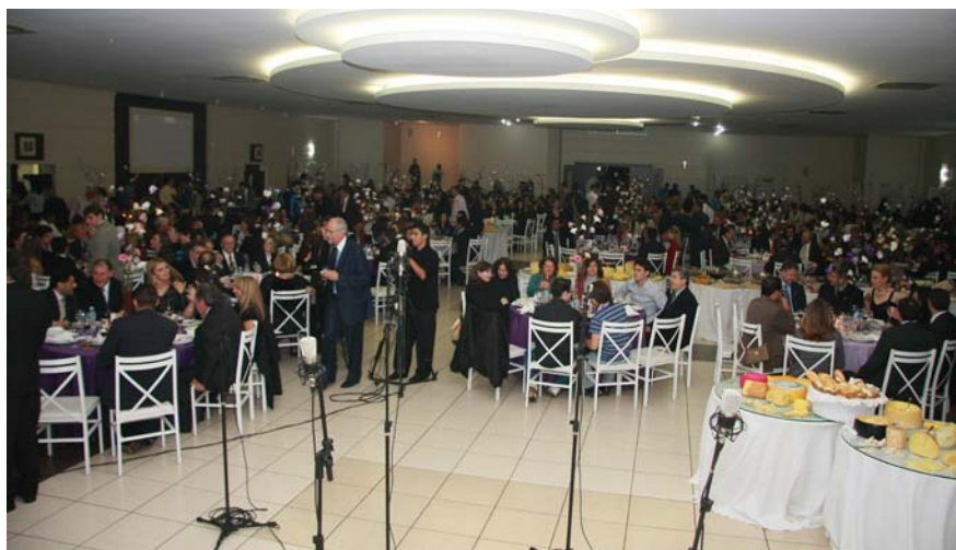
Jantar dia 16 de maio em Maringá no Mont Serrah