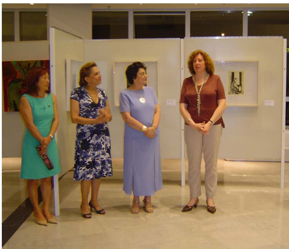
Coordenando inauguração de quadros no Espaço Cultural do CRCPR

Formada em Ciências Contábeis pela FAE, tinha especialização em auditoria. Desde os anos 1980 participava de eventos da classe contábil, como as convenções dos contabilistas do Paraná, cursos de atualização, seminários, palestras, eventos enfim de educação continuada – alguns representando o CRCPR.