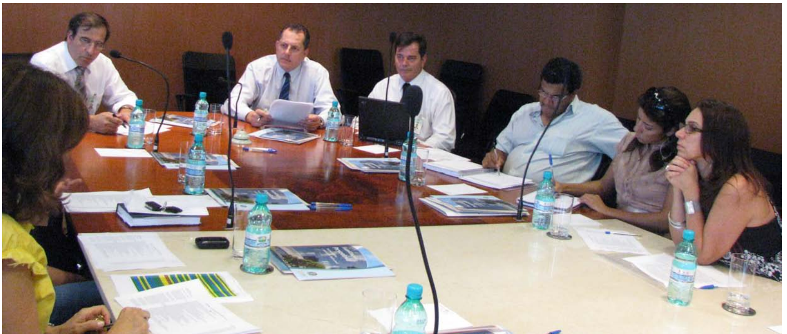
Reunião, no CRCPR, de membros do Fórum do Terceiro Setor