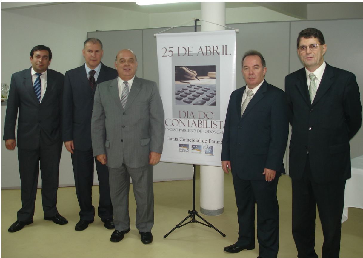
Junta Comercial do Paraná homenageia os contabilistas

e órgãos públicos”, não significando que ela esteja “alterando a sua essência”. As mudanças se dão nos sistemas de regulamentação por meio de leis.