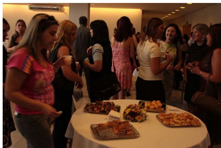
Café-da-manhã em comemoração à data

Dos 406.553 contabilistas ativos no país, 37% - 149.667 – são mulheres. No Paraná, de um universo de 27.339 profissionais, 8.012 são mulheres. Nos cursos de Ciências Contábeis, elas já são maioria.