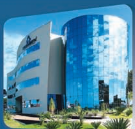
Matriz Folhamatic Americana /SP

Produtos Folhamatic. Feitos por pessoas para pessoas.