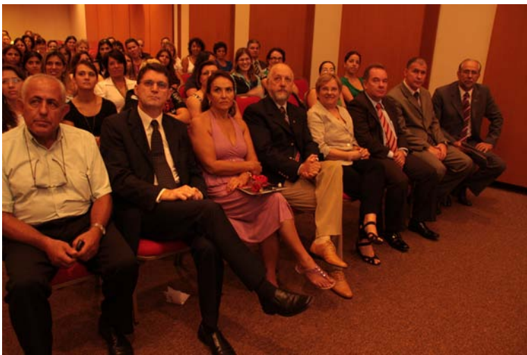
Vários dirigentes de entidades contábeis prestigiaram o evento (primeira fila)