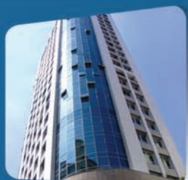
Filial Folhamatic Curitiba/PR 7º andar Ed. Glaser