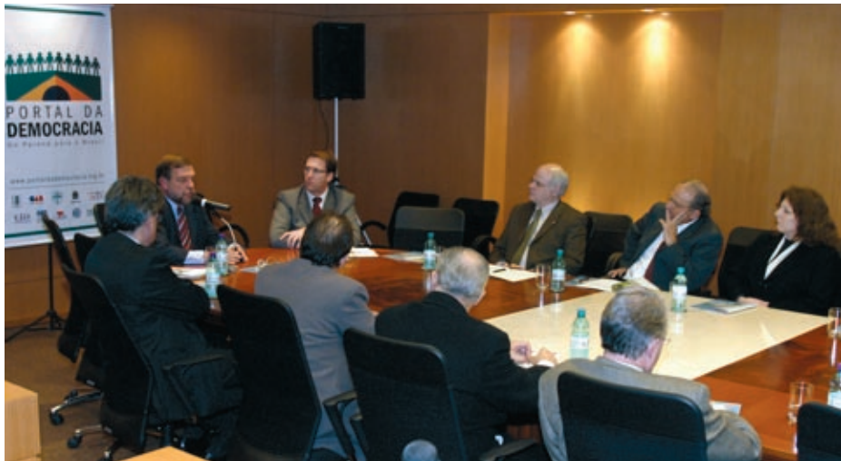
Flávio Arns fala aos representantes do Portal

Exemplo dos candidatos Osmar Dias (PDT) e Rubens Bueno (PPS), o candidato ao governo do Paraná, Flávio Arns (PT), esteve no CRCPR expondo seu programa de governo, a convite das entidades que compõem o Portal da Democracia. O encontro foi dia 27 de setembro.