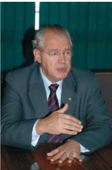
Luiz Carlos Haully

Haully (PSDB) é autor da Lei das Sociedades Anônimas (10.303/2001), Lei de Transparência Total (9.755/1998), Lei Haully (9.796/1999), colaborou na lei que criou o Simples e nas que ampliaram a sua abrangência, e é autor da emenda do Refis 3, que parcela débitos com o fisco, vetada pelo presidente Lula. O deputado foi relator da Lei Geral da Micro e Pequena Empresa. Aprovada na Câmara, aguardando definição