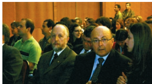
Mailson da Nóbrega (segundo da direita para a esquerda)

Apesar dos escândalos que abalam a política, as perspectivas econômicas para o Brasil são favoráveis. Não devem ocorrer mudanças bruscas na condução da macroeconomia, o que garante um horizonte otimista. A opinião é do ex-ministro da Fazenda Mailson da Nóbrega (1988-89), que realizou a palestra de abertura da VI Feira de Gestão FAE Business School, no dia 27 de setembro, a convite do SESC-PR. Suas avaliações foram acompanhadas por mais de 1000 pessoas, o maior público já registrado até agora em todas as edições do evento.