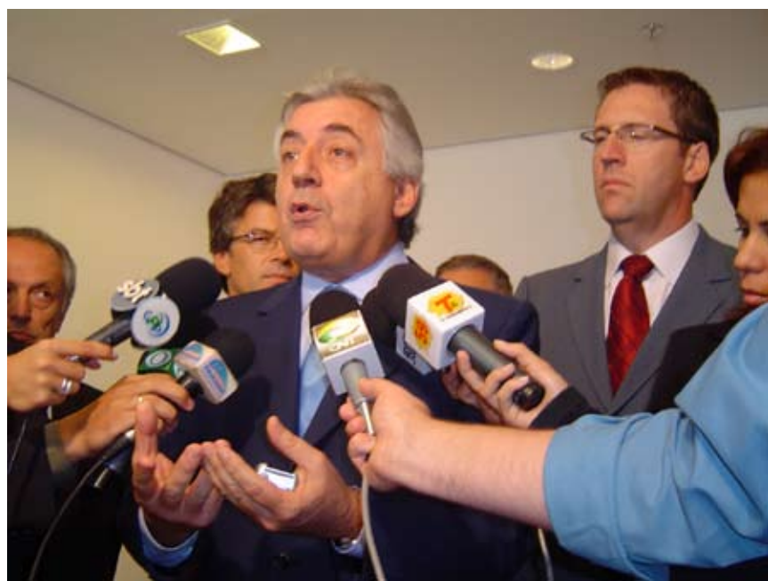
Os principais veículos da imprensa paranaense cobriram o evento

sas. Atualmente, entre tributos propriamente ditos, contribuições, gravames e encargos, o número chega a 112, totalizando 16.202 normas com 181.851 artigos. As arrecada-