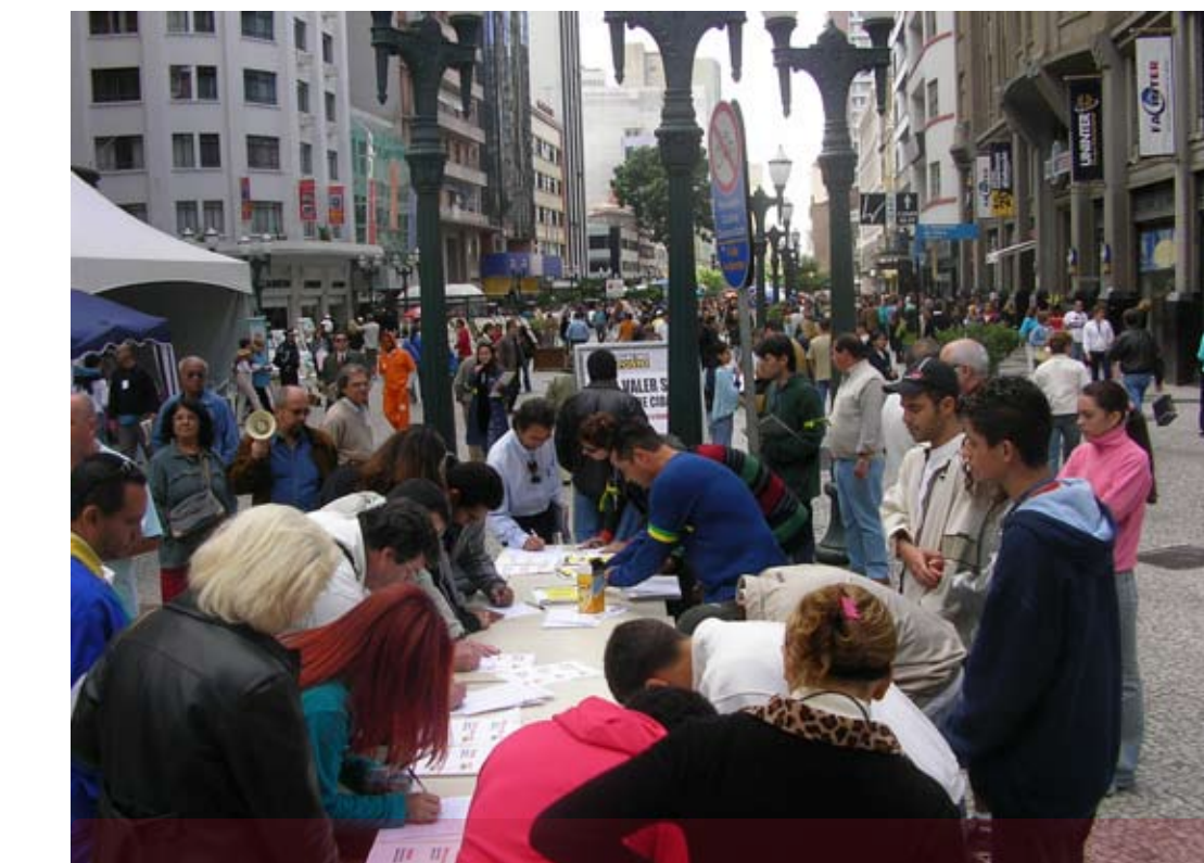
Coleta de assinaturas na Boca Maldita

as pessoas vivem, retêm apenas 15%, fato que compromete seriamente a qualidade de vida das comunidades. Segundo recente