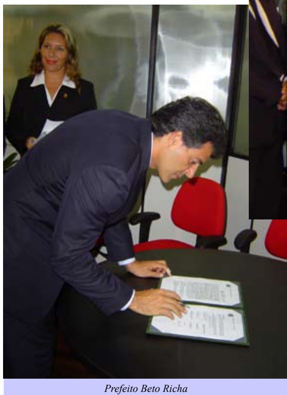
Prefeito Beto Richa

que “quem ganha com essa parceria são as empresas e os cidadãos que têm maior