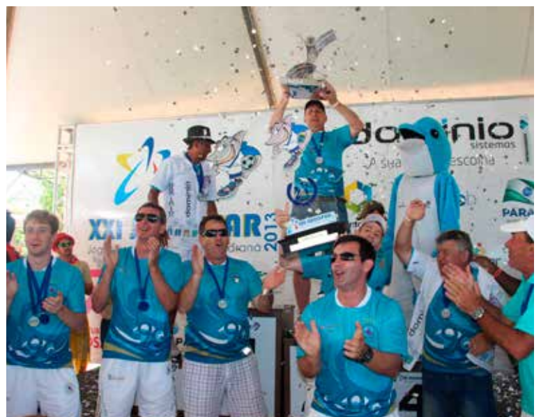
Delegação de Curitiba comemora a conquista do troféu.