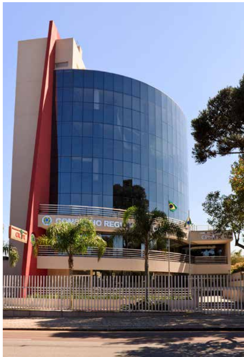
Sede do CRCPR - Curitiba/PR.

O edital prevê a nulidade da votação quando realizada em dia, hora e local fora do previsto no respectivo edital de convocação, ou ainda se ocorrer vício de fraude, coação ou falsidade que comprometa a imparcialidade e a segurança do processo.