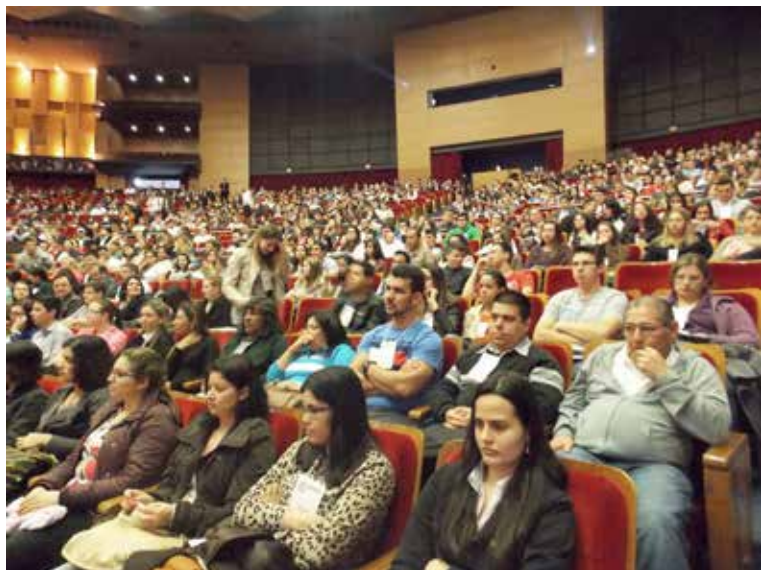
Um público aproximado de 1200 pessoas prestigiou o 13º CECOC.