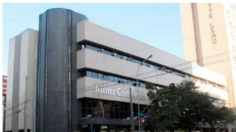
Prédio da Junta Comercial do Estado do Paraná.

Em alguns casos, os vogais ou relatores podem fazer exigência quanto ao nome escolhido, mesmo com a reserva. No processo de consulta de viabilidade, o usuário é alertado com relação a uma possível ressalva de quem analisa o processo. "A conferência do pedido não é garantia de que o mesmo será deferido, cabendo ao vogal ou relator efetuar a análise intrínseca do pedido, opinando pelo deferimento ou elaborando exigência, de acordo com a legislação vigente", informa um lembrete do sistema. Isso acontece porque pode haver, entre as empresas cadastradas na Junta Comercial, um nome semelhante ou com a pronúncia que soe parecida – o arquivo da autarquia conta com mais de 1,5 milhão de empreendimentos abertos no Estado.