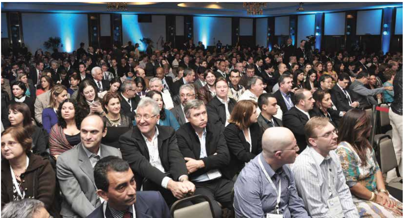
Público lotou o auditório Cataratas na noite de abertura do evento.