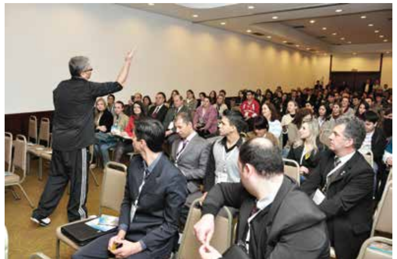
Steven Dubner emocionou o público do Fórum dos Estudantes.

A realização da 16ª Convenção dos Profissionais da Contabilidade do Paraná coube ao CRCPR e a organização foi responsabilidade do Sindicato dos Contabilistas de Foz do Iguaçu e Academia de Ciência Contábeis do Paraná, com o apoio de inúmeros parceiros, entre os quais, o Conselho Federal de Contabilidade; Sindicato das Empresas de Serviços Contábeis, Assessoria, Perícias, Informações e Pesquisas e sua federação - Fenacon, Federação dos Contabilistas do Paraná, Instituto Paranaense da Mulher Contabilista, Confederação Nacional das Profissões Liberais, Itaipu Binacional, Convention Bureau de Foz do Iguaçu e outros sindicatos e associações de contabilistas do Paraná.