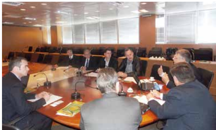
Grupo de estudos vai incentivar a formação de árbitros e mediadores da classe contábil para atuarem em conflitos relativos a direito patrimonial.