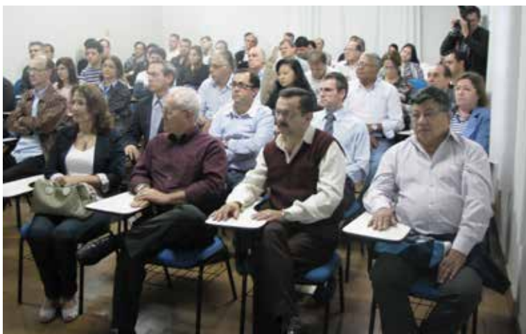
Abertura da fiscalização em Foz do Iguaçu.

A té o final de maio, a fiscalização do CRCPR já havia analisado um total de 32.641 dentre os principais documentos, escriturações contábeis (7.899), contratos de prestação de serviço (4.235) e declarações de rendimentos-Decores (7.524), depois de percorrer 70 municípios. Para realizar esse trabalho, a equipe de fiscais visitou 624 profissionais, 466 organizações contábeis, 135 empresas não contábeis, 169 órgãos públicos e seis instituições financeiras.