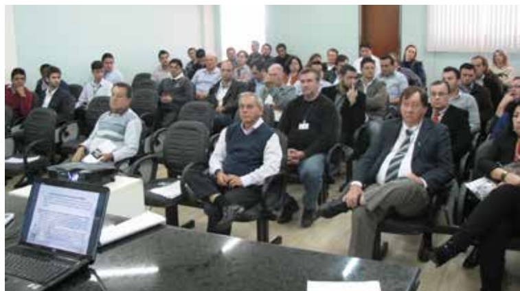
Abertura da fiscalização em Arapongas.

Obrigado ao SPED Perfil A? Nossa solução gera o Perfil A desde o início do projeto com tranquilidade, agilidade e segurança.