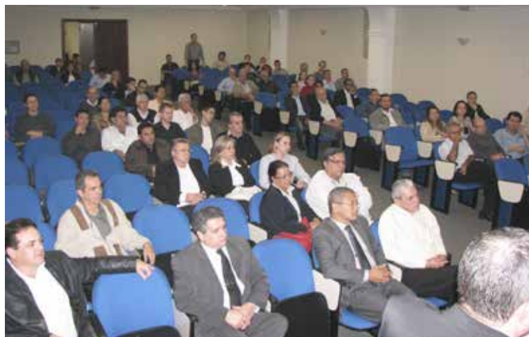
Abertura da fiscalização em Londrina.