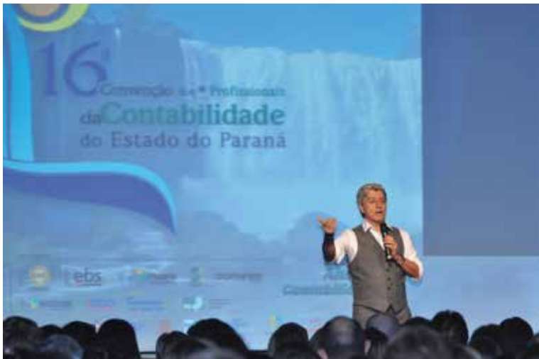
Caco Barcellos ministrou a palestra magna de encerramento, dia 17.